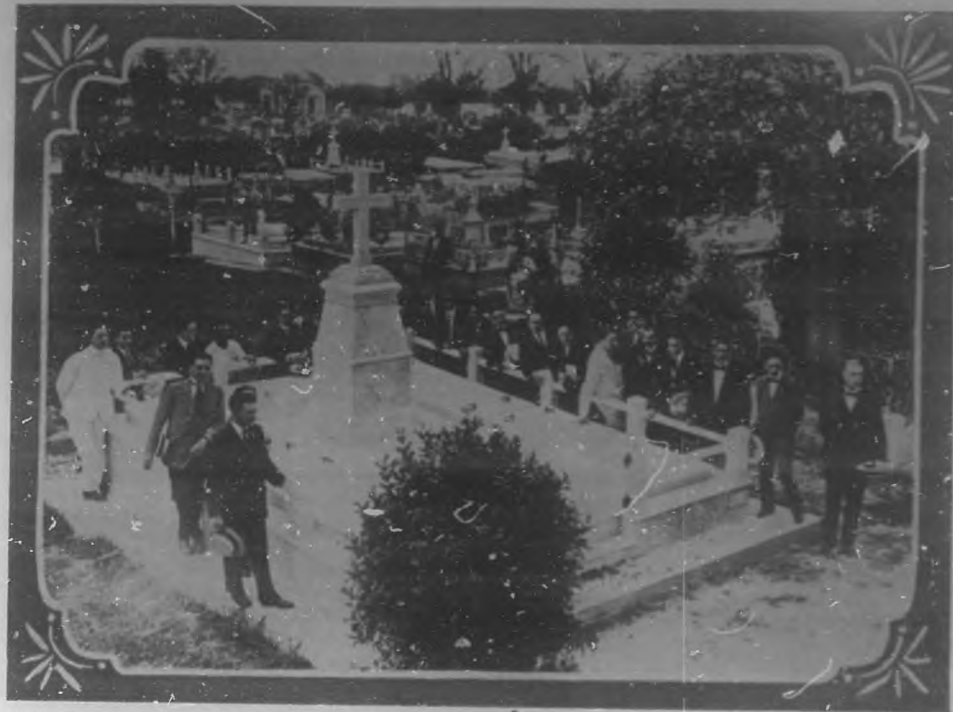
PANTEON DE LOS REPORTERS.—Recepción oficial del panteón que los reporteros han construido en el Cementerio de Colón, el que ha sido objeto de un conflicto con el Obispaño, el fin solucionado satisfactoriamente entre ambas partes.

lísima compañía que actúa en este elegante Coliseo su temporada con la célebre obra "Aida", que ha sido un éxito.