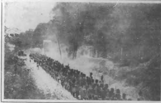
Escena de la importantísima película "Escuela de Héroes", que será estrenada próximamente en el Gran Teatro Politeama por la empresa Santos y Artigas.

—Sí, señor, ya lo creo. ¿Como que el po-