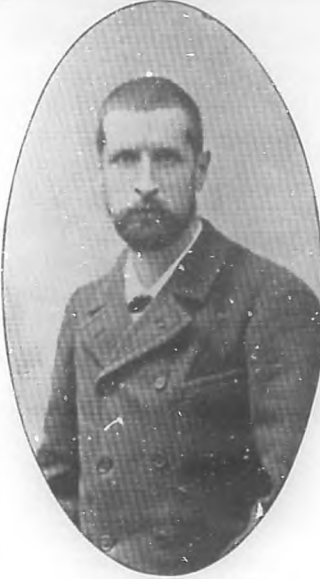
1863 DR. A. E. J. YERSIN

Director de Sanidad. Ex-Profesor de Patología General de la Universidad de Pinar del Río. Profesor de Patología General y Medicina Tropical de la Universidad de la Habana. Ex-Decano de la Facultad de Medicina y Farmacia de la Universidad de la Habana en los Estados Unidos y de la Universidad de Cuba.