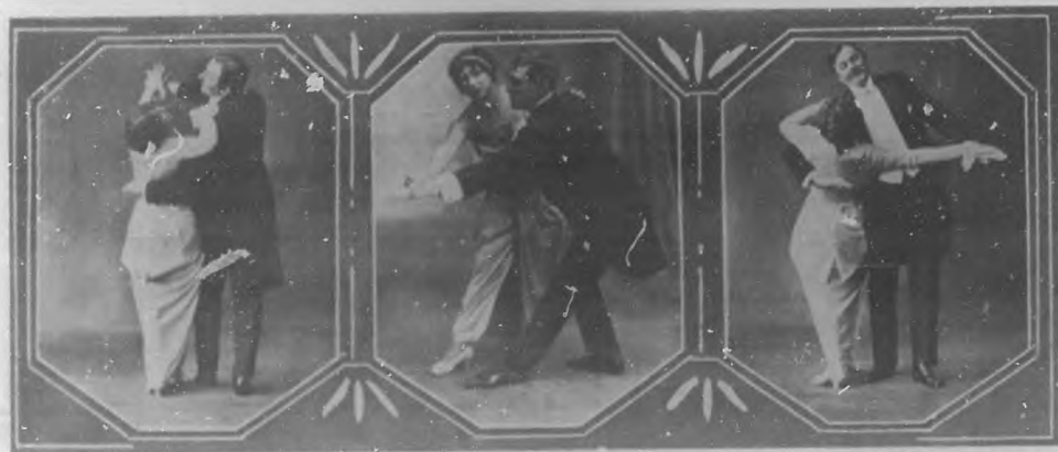
LA FURLANA. Algunos momentos de esta danza elegante veneciana, cuya consagración en los salones del gran mundo se atribuye a recomendación del Papa.

En Francia, lo mismo que en Inglaterra y en España, la aparición de la danza de los apaches en los teatros y music-halls fue recibida con extraordinaria complacencia por el grand monde , the high life, el gran mundo. Aquel número de variétés que representaba, dulcificada por el arte (¡pobre arte!) las carísimas amorosas bailables del macho inmundo que golpea a la hembra de quien vive y de la que es sumisamente amado, fue un manjar muy del gusto del público elegante, de las señoras que no salen a la calle sin sombrero y de los caballeros que van al teatro de frac. Tan es así, que en los salones de la alta sociedad se puso de moda la danza de los apaches; se dieron bailes a los que damas y caballeros debían asistir y asistieron con la indumentaria propia de las gentes que pululan por las tabernas y las calles non sanctas de las grandes ciudades, para bailar con ese