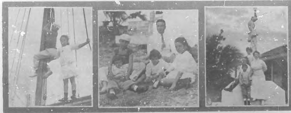
EL PRESIDENTE DE LA REPUBLICA EN EL MARIEL. — Tres vistas interesantes de los hijos del Presidente de la República, durante su estancia en el poblado pintoresco.

"Bohemia" rinde un tributo de condolencia y sentimiento en la tumba del benemérito, y envía a sus deudos pésame sentido.