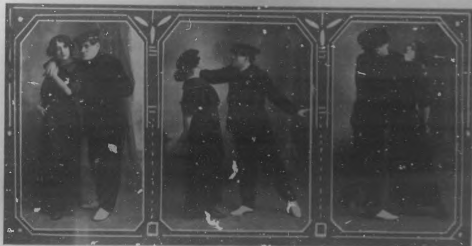
LA DANZA DE LOS APACHES. — Distintas figuras del colabre baile, que tan ruidosamente fue acogido y celebrado a su aparición y que en los teatros produce desbordante entusiasmo.

Como absorbe el individuo organizado este alcohol que parece engendrar en la atmósfera las vibraciones de los sonidos melódicos, es un misterio que la Ciencia esclarecerá algún día, cuando tal vez nosotros que pudiéramos verlo como vemos las partículas de polvo en un rayo de sol. En zombos comprendemos claramente por qué a cual melodía nos embriagaba de ardor místico, bélico o sensual. Por ahora debemos limitarnos a usar de la Música sin abusar, para libertarnos del vicio milenario del baile, rasgo tal vez el primero por donde nos reconocerán como semejantes suyos, o resucitarán, aquellos ancestrales nuestros que en el fondo de la selva danzaban, cogidos de la mano, al compás de sus alaridos, alrededor de la hoguera que iluminaba