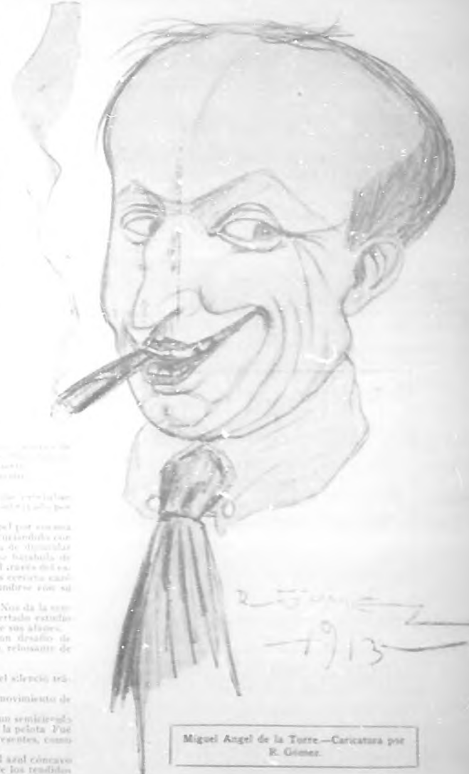
Miguel Angel de la Torre—Caricatura por R. Gómez.

La Gloria de la Familia... me refiero a la gloria... Miguel Angel de la Torre... recordo otro grito amargo, aunque de distinto carácter; que se escuchó por decirlo así, en las primeras páginas de la más famosa obra del maestro francés.