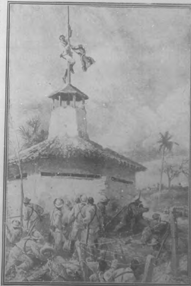
Escena sublime de la toma de Guáimaro por los héroes patriotas de Yara.

ma y personalidad jurídica al esfuerzo de la epopeya; y allí congre-