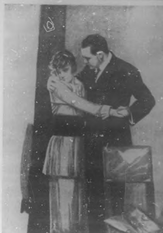
—Mary, te amo, ya ves que vivo.