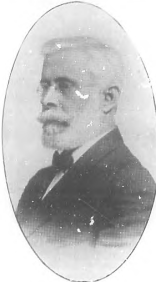
Dr. Juan Guiteras