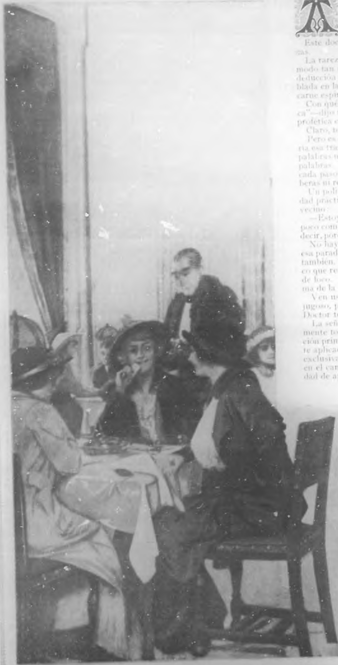
«¿Quién es ese señor?» preguntó una joven rubia.

A hora no se recibieron con picarescas risas las palabras del Doctor.