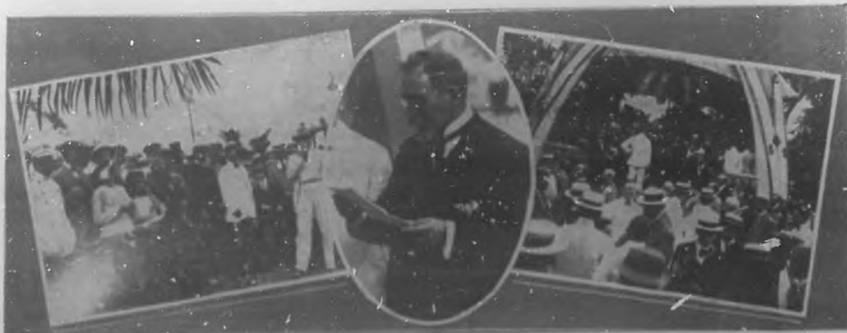
La Exposición ganadera en la Quinta de los Molinos.—El Presidente de la República en los terrenos de la Exposición en el acto de la apertura. El general Emilio Núñez leyendo el discurso de apertura. Tribuna del Jurado y aspecto de la concurrencia.

La temporada de Opera.—En Payret ha inaugurado la notabi-